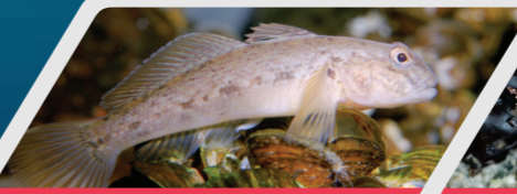
Gwyniaid du'r môr Black sea gobies